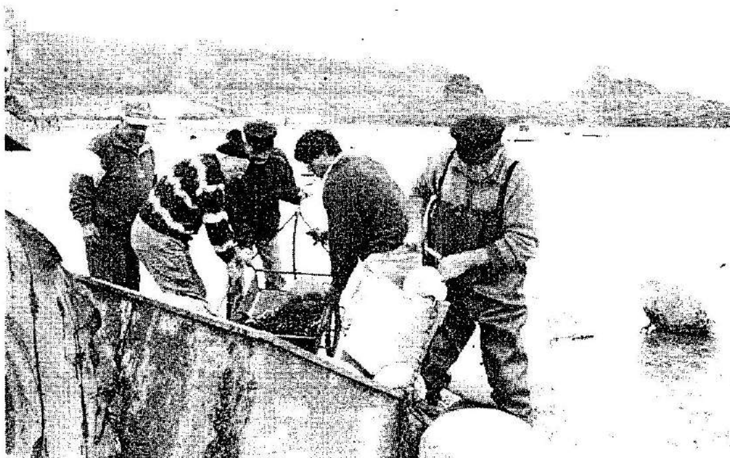
Grosse activité au bas de l'eau pour la remise en place des lignes de mouillage.